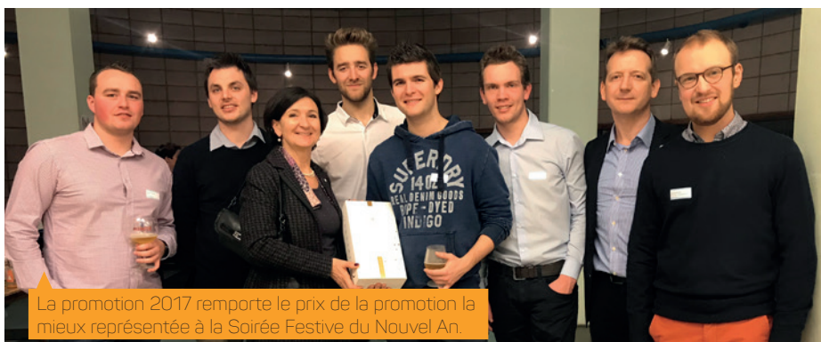
La promotion 2017 remporte le prix de la promotion la mieux représentée à la Soirée Festive du Nouvel An.