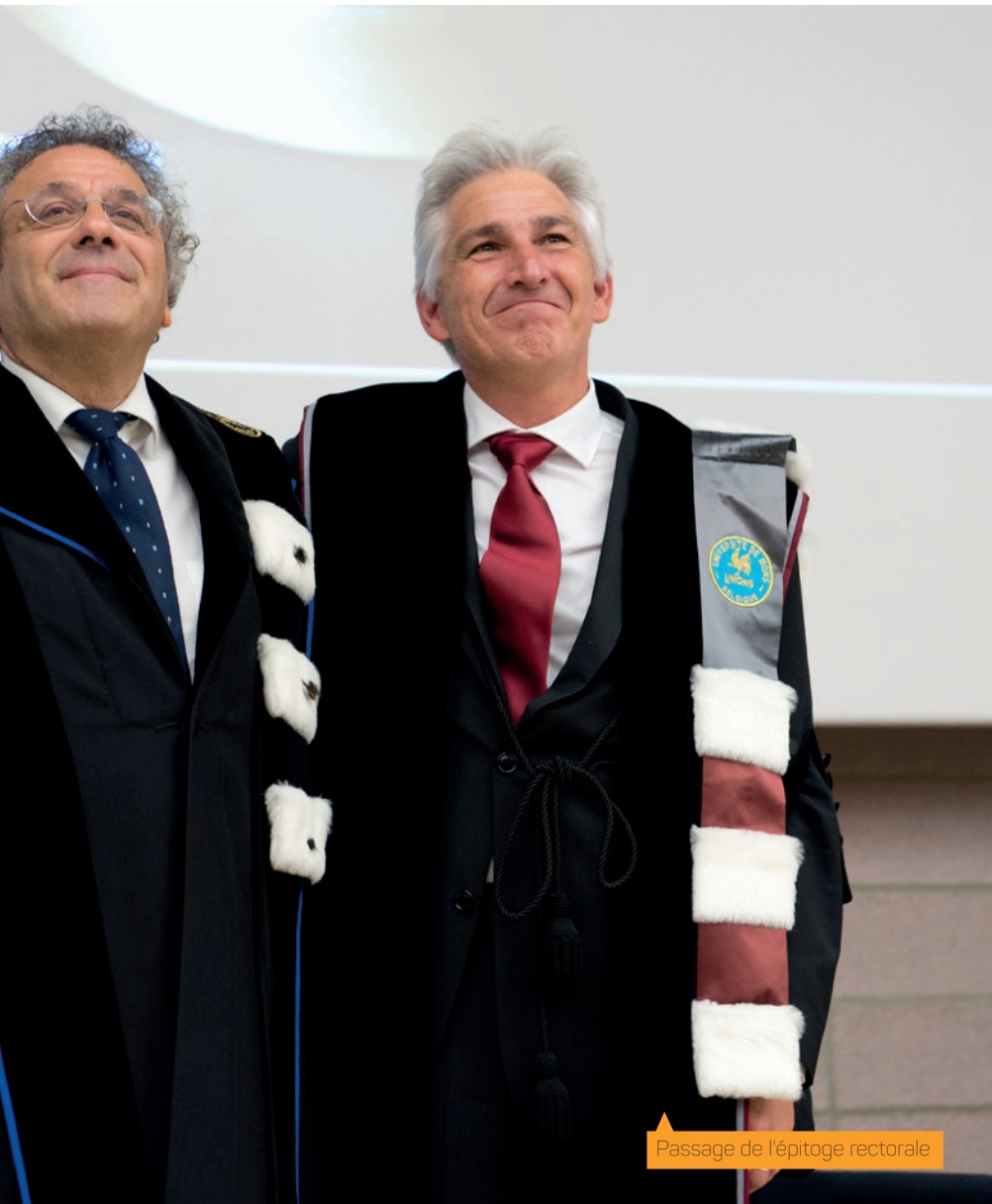
Passage de l'építoge rectorale

Depuis sa création, le service Alumni de l'UMONS veille à consolider le réseau, la famille serais-je tenté d'écrire, des anciens de l'UMONS. Et ses services et actions (aides à l'emploi, activités de réseautage) s'adressent à toutes les diplômées et tous les diplômés de l'institution. Ils sont parfaitement complémentaires à l'adhésion aux associations d'anciens telles que l'AIMs.