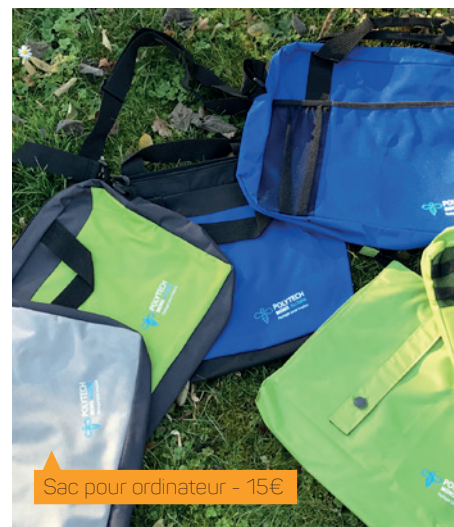
Sac pour ordinateur - 15€