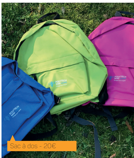
Sac à dos - 20€