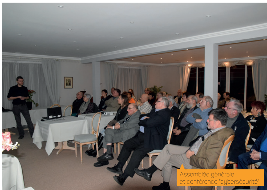
Assemblée générale et conférence "cybersécurité"