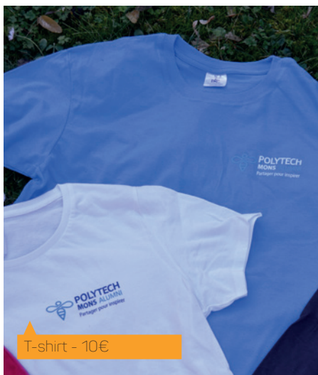
T-shirt - 10€

Rue de Houdain 9 – 7000 Mons Tél. : +32.65.37.40.38 Mail : aims.bi@umons.ac.be