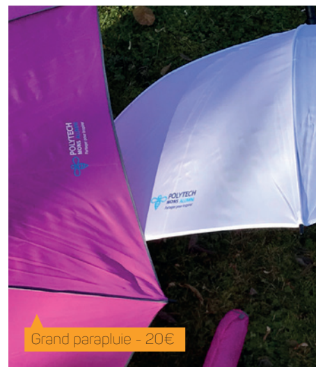
Grand parapluie - 20€